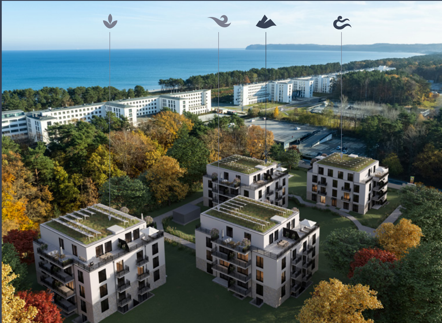
Abbildung aus Sicht des Illustrators